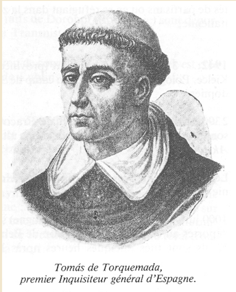
Tomás de Torquemada, premier Inquisiteur général d'Espagne.

1491. — A La Guardia (Espagne), 5 juifs sont arrêtés sous l'accusation d'avoir tué un enfant dont le corps n'a jamais été retrouvé. 3 d'entre eux sont des juifs baptisés de force. Ils sont garrottés et brûlés. Les autres sont écartelés. Le dominicain Tomàs de Torquemada, responsable des persécutions, vise à renforcer les sentiments antijuifs en Espagne.