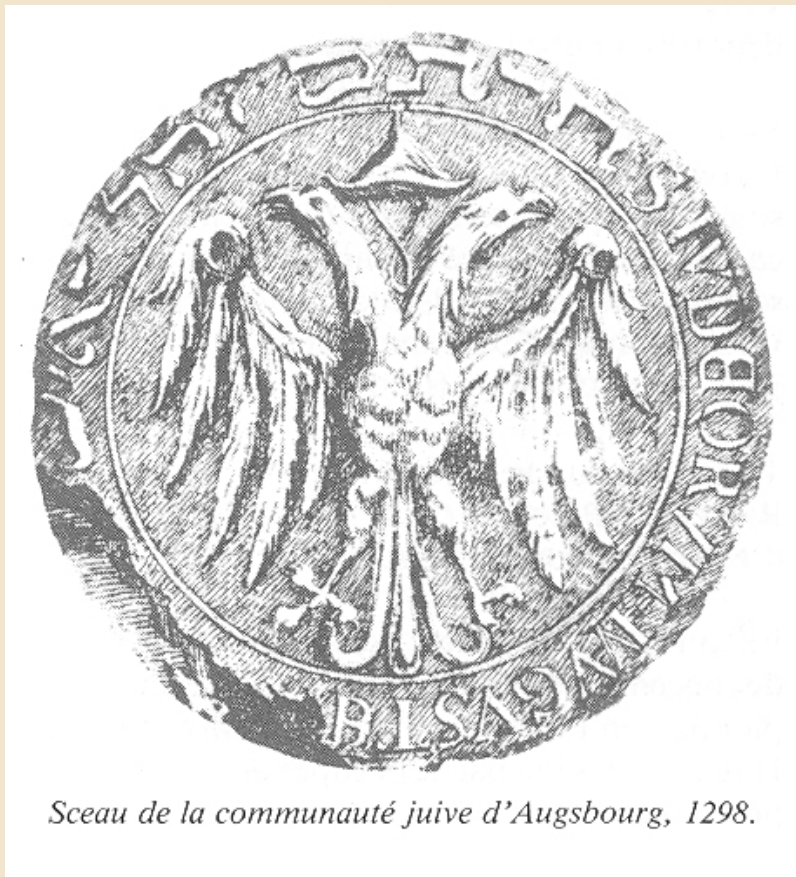
Sceau de la communauté juive d'Augsbourg, 1298.