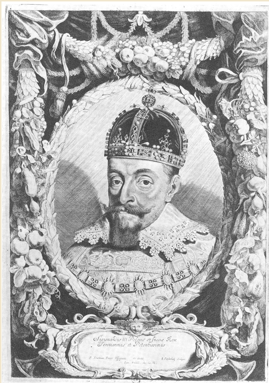
Sigismund III, roi de Pologne et de Suède (1566-1632).

1696. — 14 hommes et femmes sont brûlés vifs et 4 en effigie au cours d'un autodafé tenu à Coimbra (Portugal). Ils étaient accusés de « judaïser », c'est-à-dire de pratiquer le judaïsme en secret.