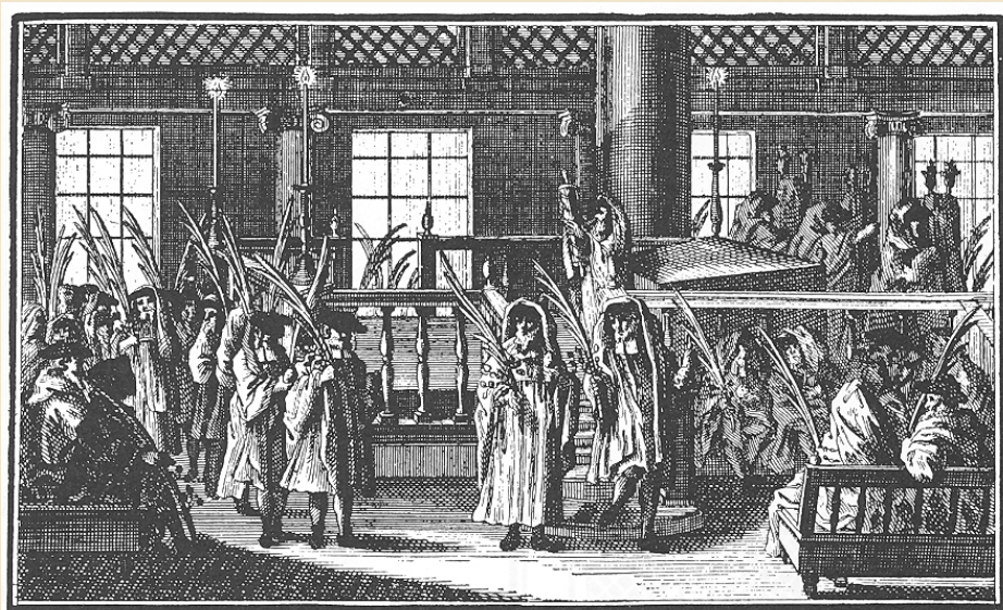
Procession avec palmes durant la fête des Tabernacles. (Gravure allemande, 1748).

Un convoi quitte le camp de regroupement de Drancy (France) avec 210 juifs déportés au camp d'extermination d'Auschwitz, où tous sont assassinés.