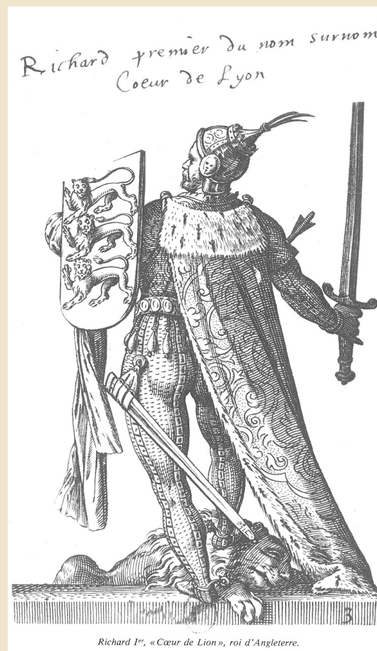
Richard I er « Cœur de Lion », roi d'Angleterre.

1943. — Un convoi de 3 000 juifs quitte le ghetto de Bochnia (Pologne) pour le camp d'extermination d'Auschwitz, où les déportés sont tués dès leur arrivée.