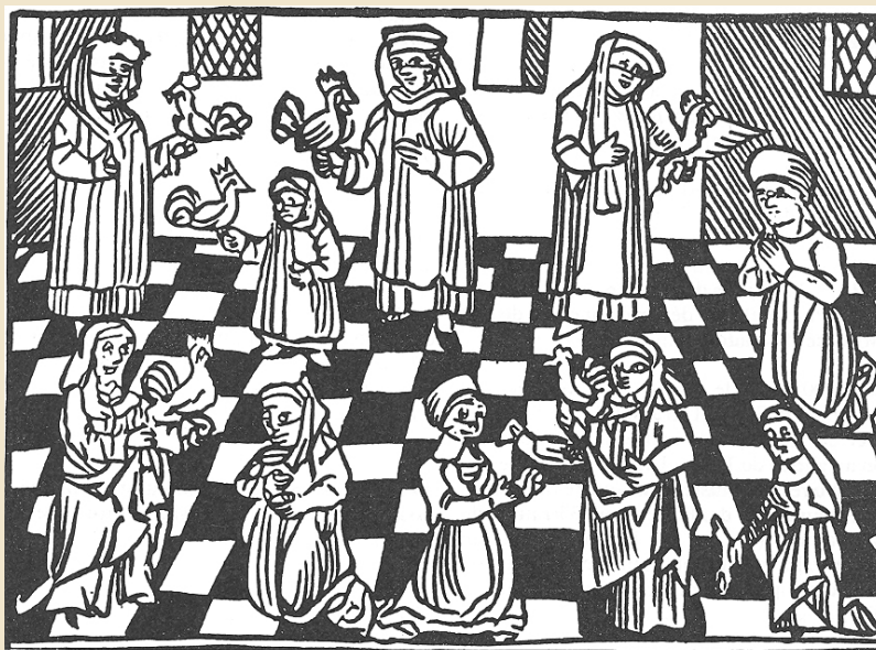
Cérémonie à la veille de Yom Kippour, d'après une gravure en bois d'Augsbourg (1530).

1942. — En ce jour de Kippour, 1 200 juifs de Suchedniow (district de Kielce, Pologne), 1 200 juifs de Sendziszov (district de Cracovie) et 6 000 juifs de Wegrow (district de Varsovie), où a lieu une Aktion de trois jours, sont déportés au camp d'extermination de Treblinka.