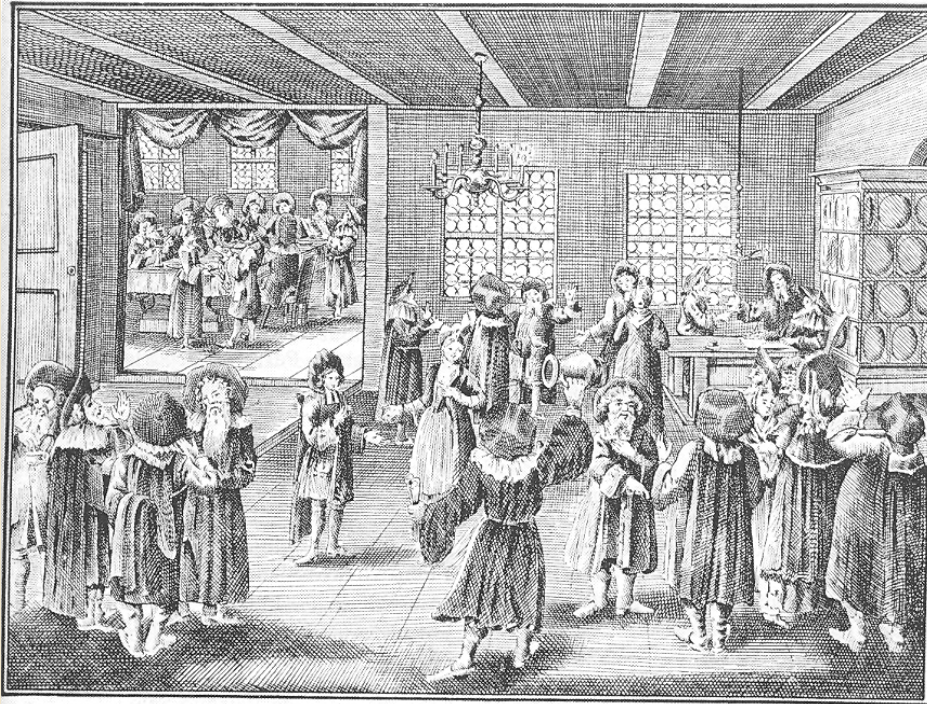
Fiançailles juives à Nuremberg (d'après Kirchner, Judisches Zeremoniell, 1726).

nazis occupent Bilgoraj (province de Lublin), où vivent 5 000 juifs.