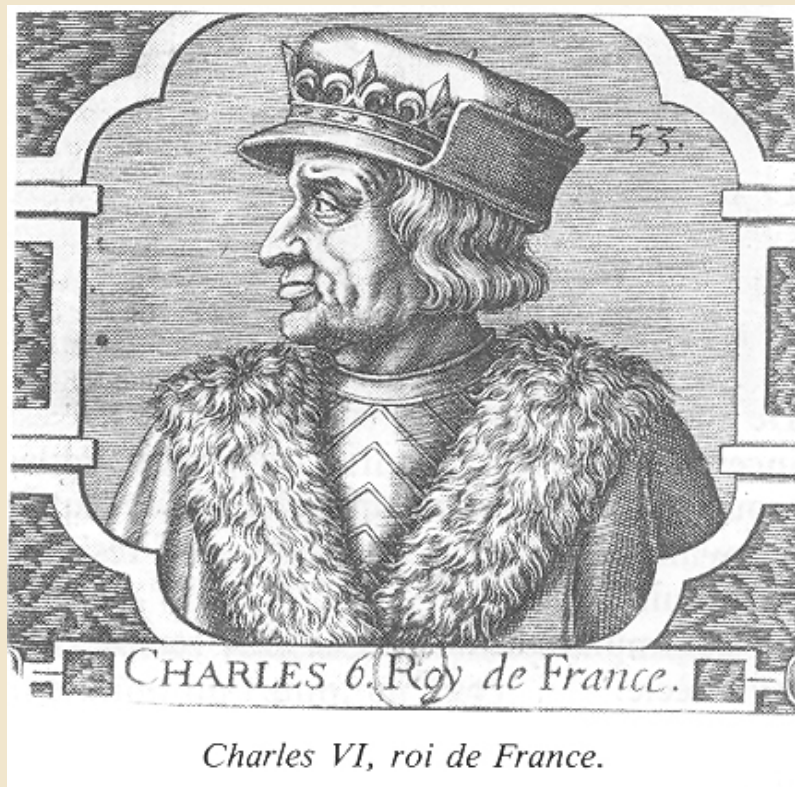
Charles VI, roi de France.

1394. — Le jour de Kippour (ou du Grand Pardon, le plus respecté du calendrier juif), le roi de France Charles VI ordonne l'expulsion des juifs de tous ses territoires.